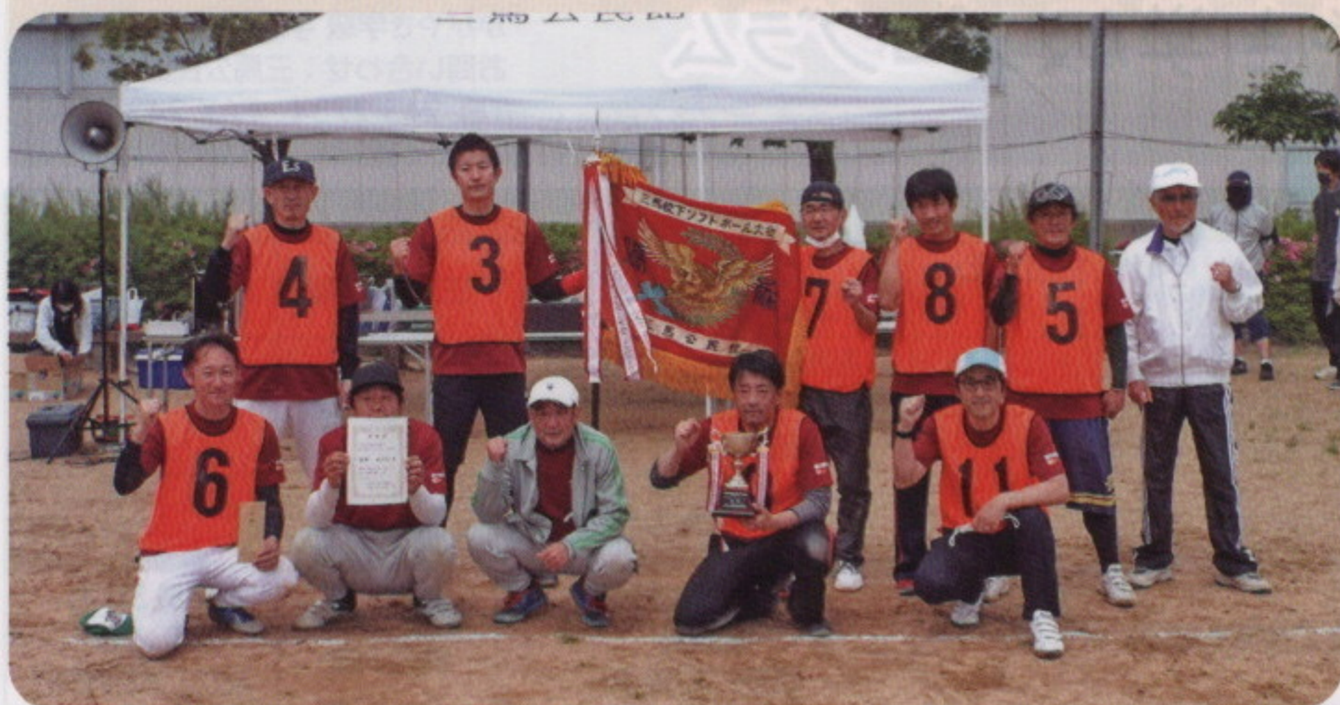
3年ぶりに開催されたソフトボール大会。 12町会のみでの参加となりましたが、白熱した試合展開で、大変盛り上がりました。