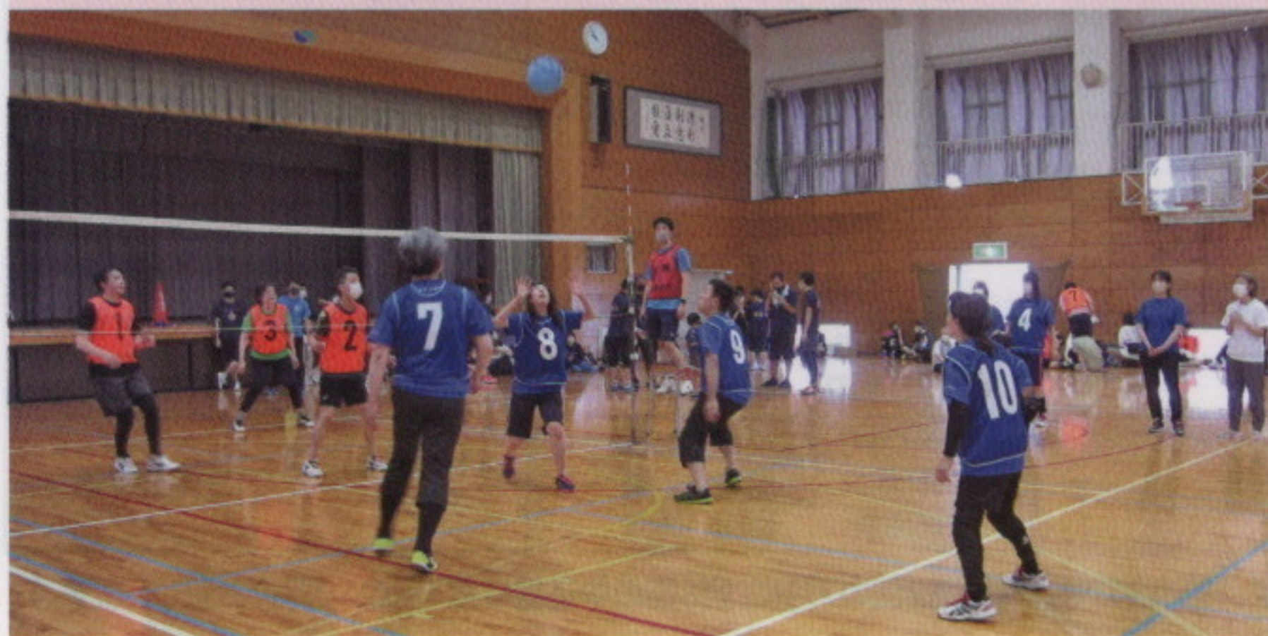
12町会21チームで、全てトーナメント方式での試合を行いました。 家族ぐるみで参加された町会も多く、和気あいあい、楽しく終えることができました。